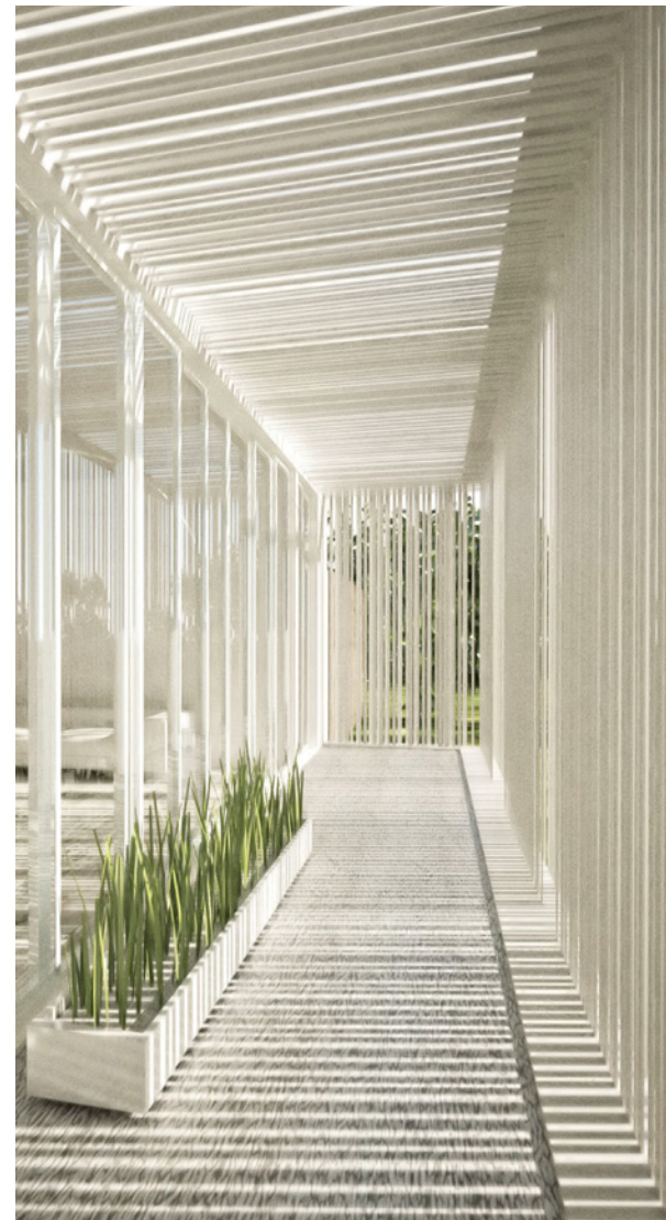
El patio frontal permite una extensión de la sala de estar. Sirve como una zona de separación entre los espacios interiores y exteriores con la función de un patio.

“La economía se logra mediante el uso de los métodos más rudimentarios de construcción proporcionados por la industria local (estructura de hormigón armado) y mediante el control de las